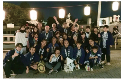
高田南睦のメンバー

その神田川沿いの砂利場、西早稲田、高田一丁目、二丁目、三丁目、高田馬場迄広範囲に会員が居ります。なので、十六日の町内廻りは、お仮屋から出発して明